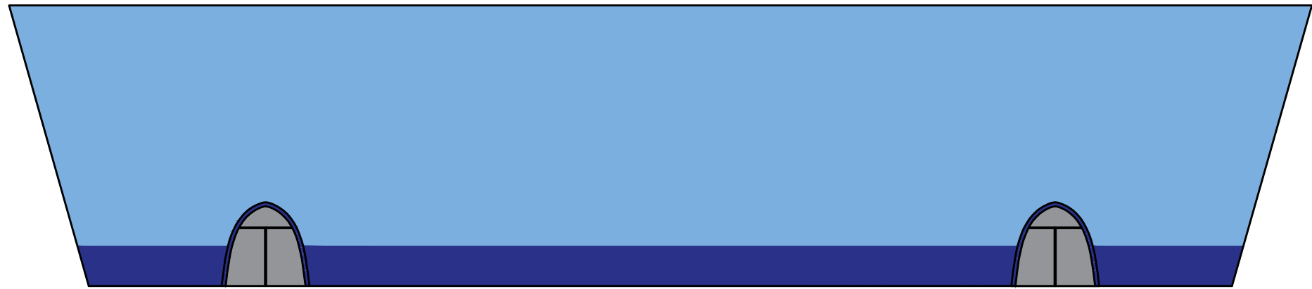
VISTA FRONTAL escala 1 : 200