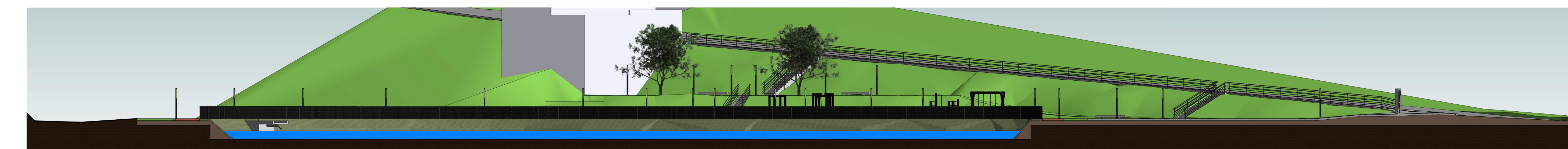
2 CORTE B 1:300